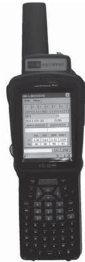
PSION Workabout Pro + Carnet électronique GenOvis