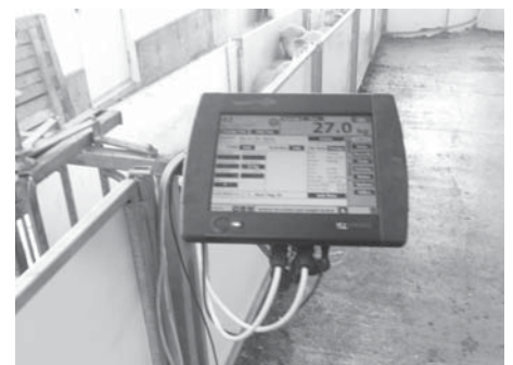
Gallagher Smart Scale TSI