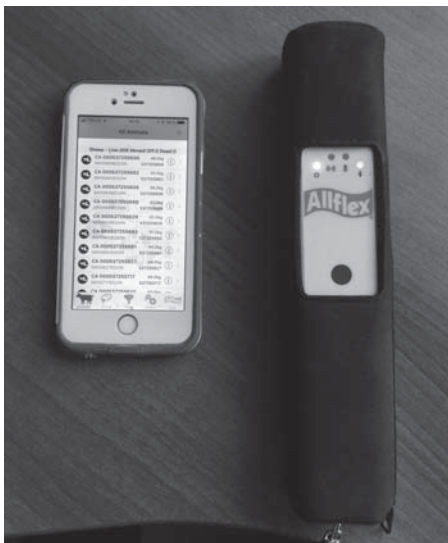
Allflex LPR + logiciel Livestock