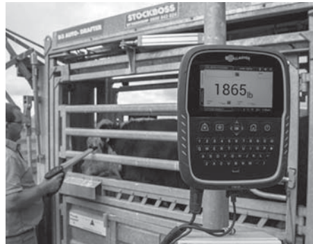
Gallagher TW3 + Smart Reader HR4