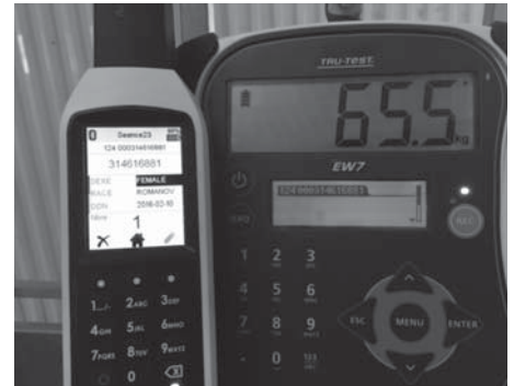
Tru-Test XRS2 ET EZYWEIGH 7