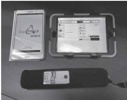
Allflex LPR + application SimpliTRACE + BerGère mobile PC