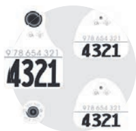
Fig. 2 Le modèle Ultraflex, de forme arrondie, a remplacé le REG à partir de mars 2011.