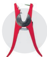
Fig. 4 Il faut employer la bonne pince pour fixer l'identifiant.