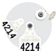
Fig. 1 Le modèle REG a été produit, avec certaines variations, de 2001 à mars 2011.

Selon la base de données d'ATQ, il resterait près de 180 000 identifiants REG toujours en stock dans environ 8 000 fermes bovines, et ce, même si on a arrêté de vendre ce modèle en 2011! En somme, plusieurs producteurs pourraient se servir des identifiants REG qu'ils ont en stock malgré l'accessibilité de l'identifiant Ultraflex. Malheureusement, en 15 ans, certains de ces identifiants ont pu subir une dégradation matérielle qui réduit leur qualité de rétention. →