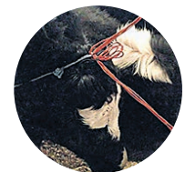
Fig. 7 Les cordes restent souvent prises dans les identifiants, causant la perte de ceux-ci.