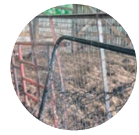
Fig. 8 Les clôtures dont les mailles sont brisées peuvent être responsables de la perte d'identifiants.