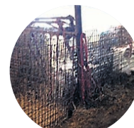
Fig. 5 Les séparateurs de ce genre sont parfois responsables de la perte d'identifiants.