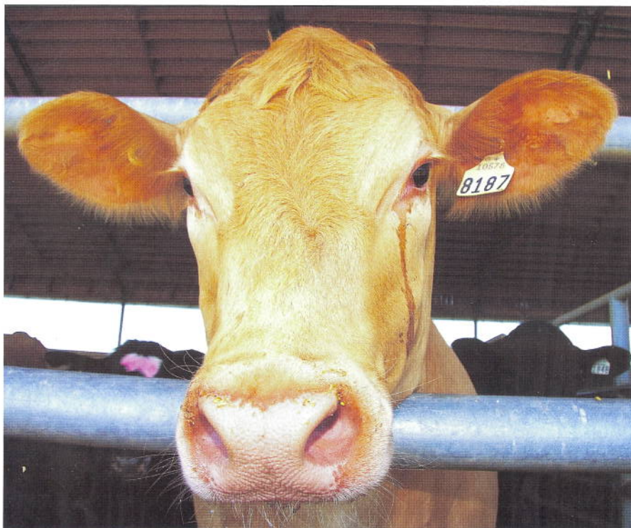
Le projet ne vise pas à identifier l'animal, le producteur ou la ferme d'origine d'une pièce de viande spécifique.

Ce modèle doit répondre d'une part aux besoins de rappel des aliments et, d'autre part, aux réalités des entreprises.